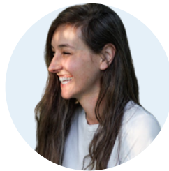
Cat Martel Photographe