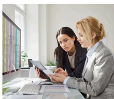
La société par actions (inc.)