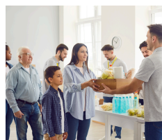
L'organisme à but non lucratif (OBNL)