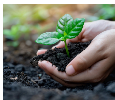
La certification Bcorp